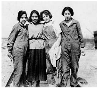
Mexicana workers/Los Angeles 1920s