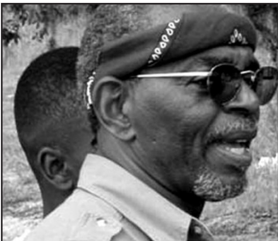
Foto: Omali Yeshitela, Secretario General del Partido Socialista del Pueblo Africano

Además, en una situación como la de África, nacida de una relación parasitaria, sobre la cual, el edificio completo del imperialismo descansa, y dividida en microestados inestables y distorsionados que existen sólo como estructuras para transferir recursos a los países imperialistas. Hasta el proceso de producción funciona en contra de los intereses del pueblo, puesto que la producción nunca nos podría beneficiar a nosotros.